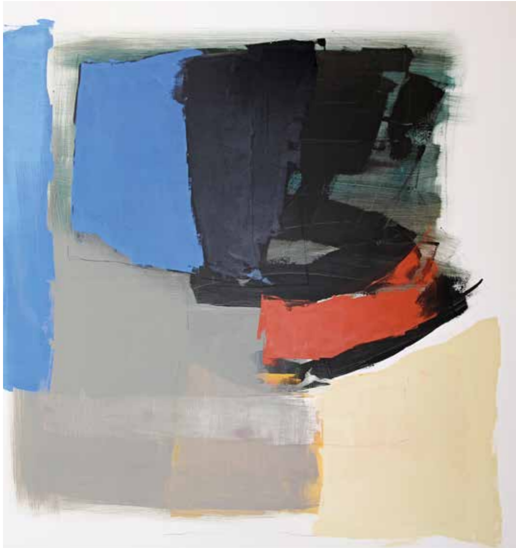
libera scelta 9