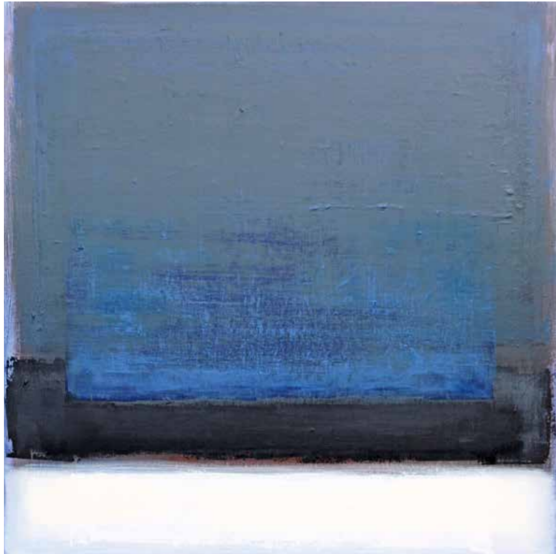
senza titolo 16