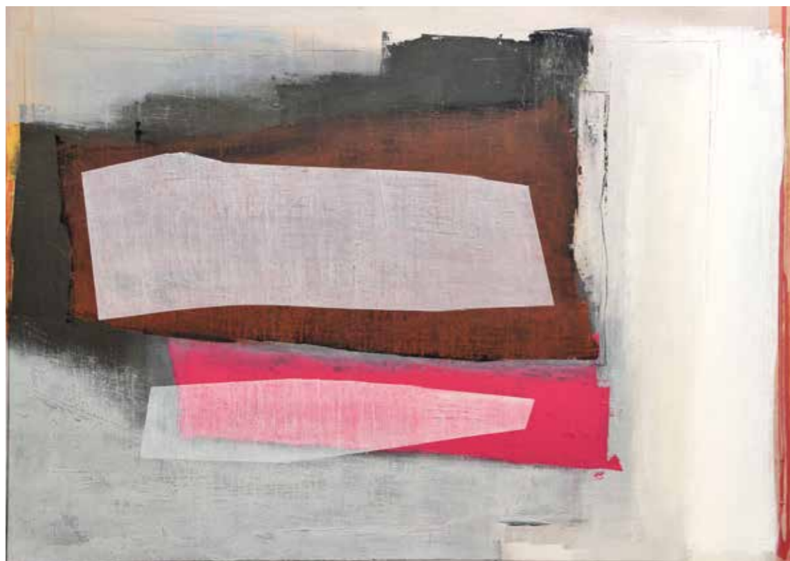
visita inaspettata 7