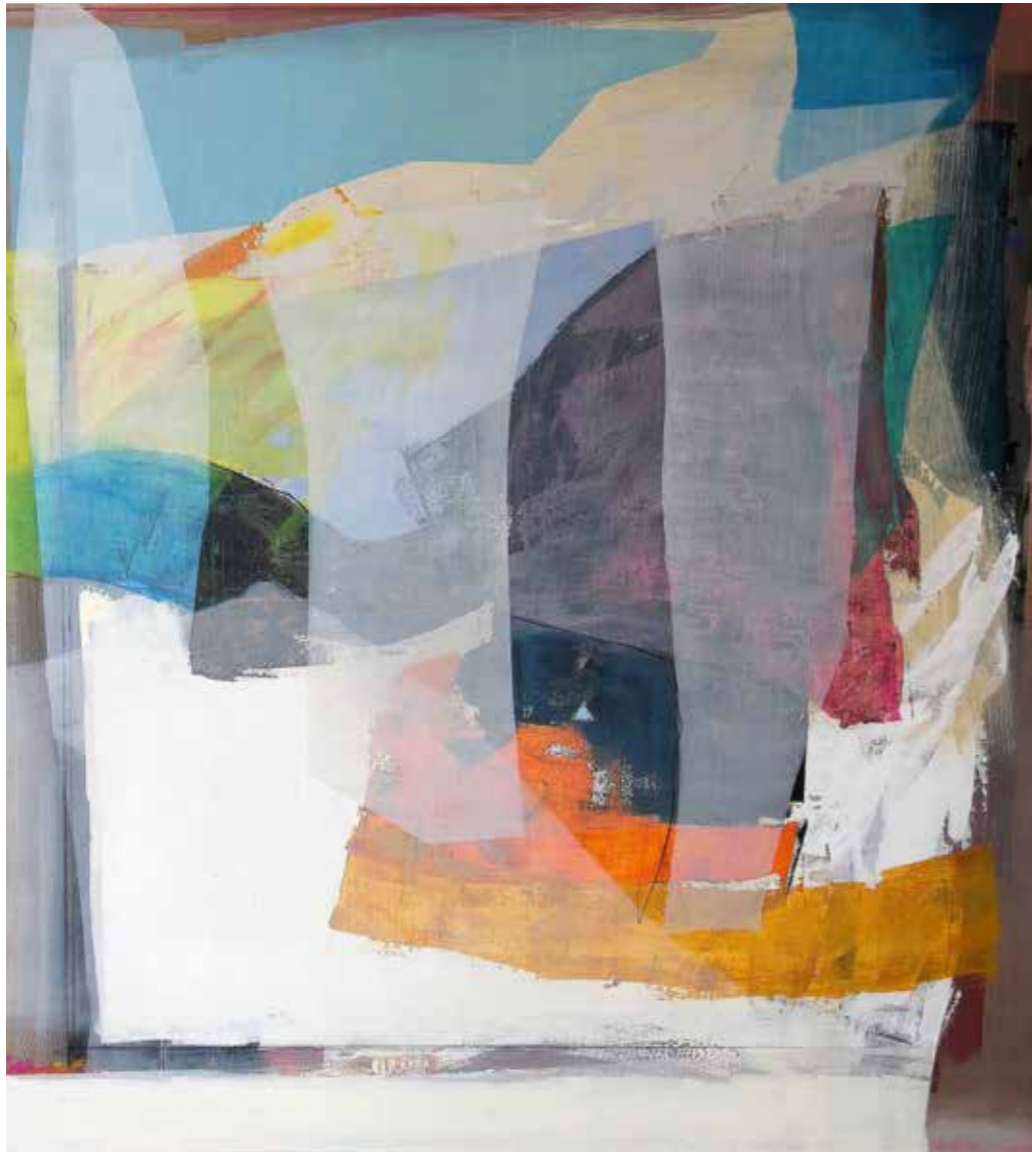
libera scelta 1