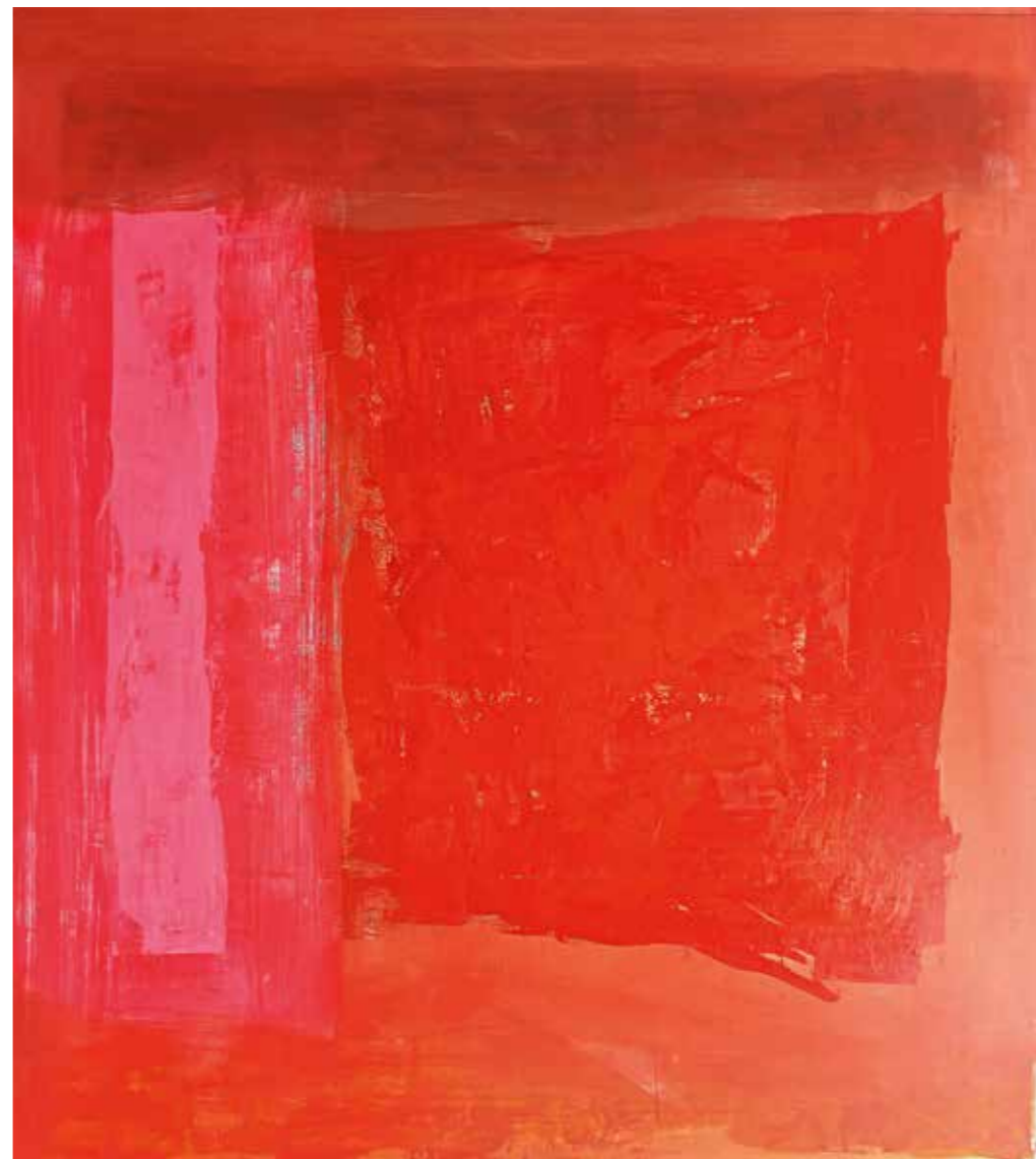
centro rosso 4