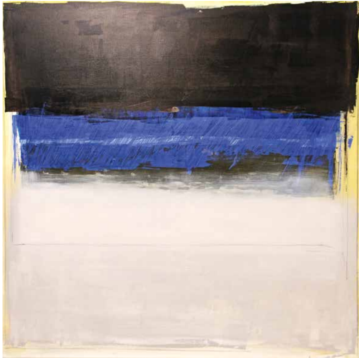
you name it 4