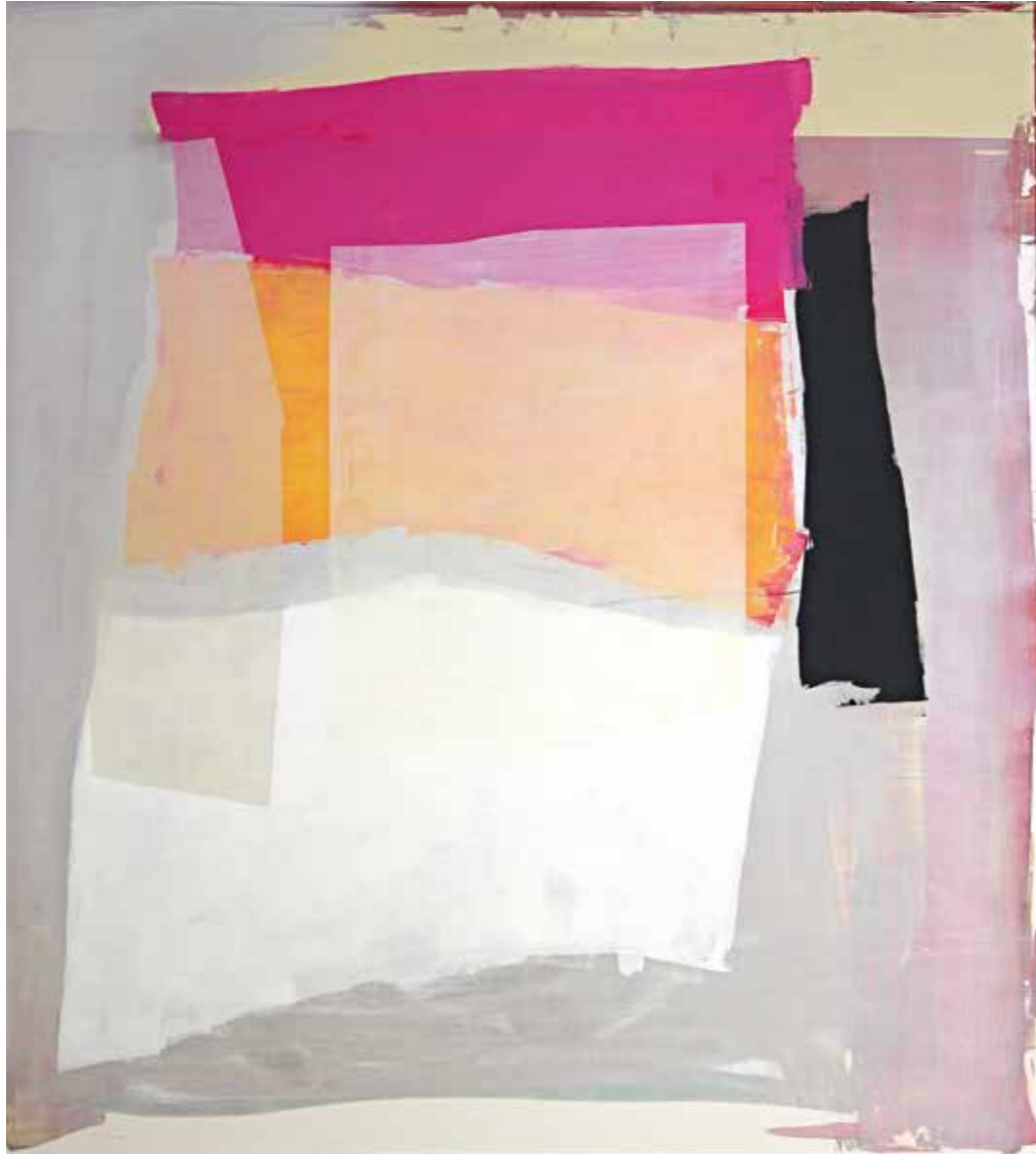
you name it 2