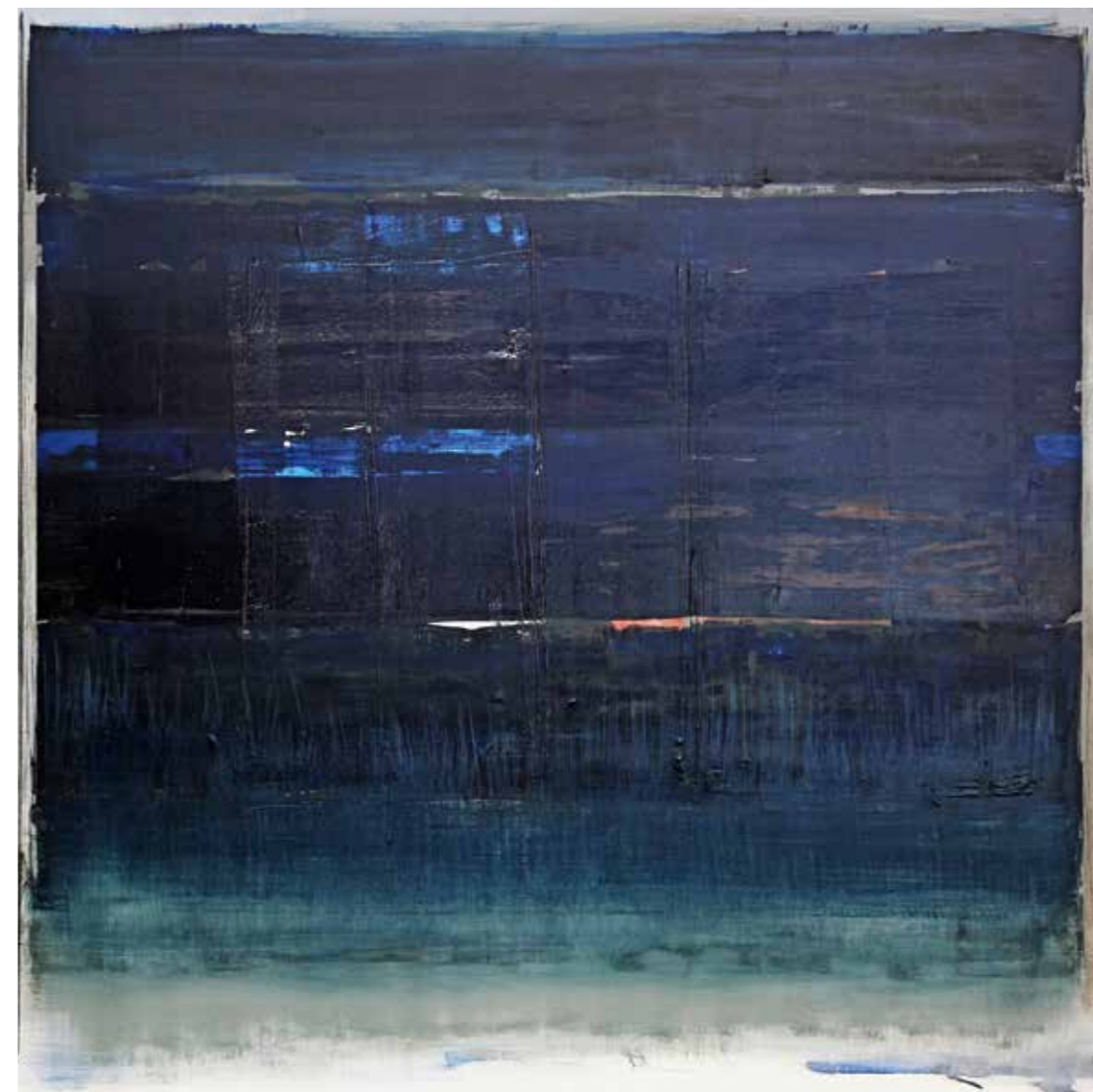
senza titolo 31