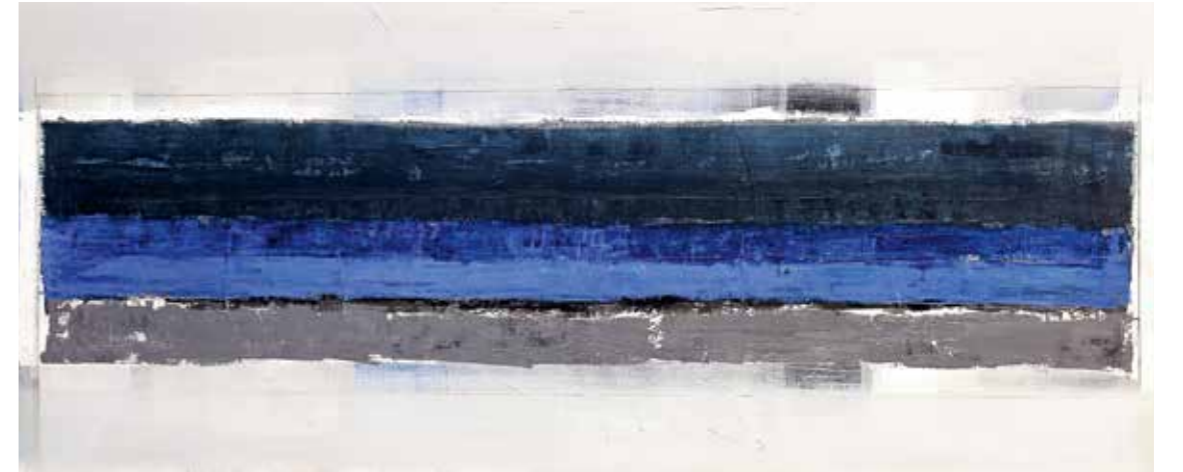
you name it 14