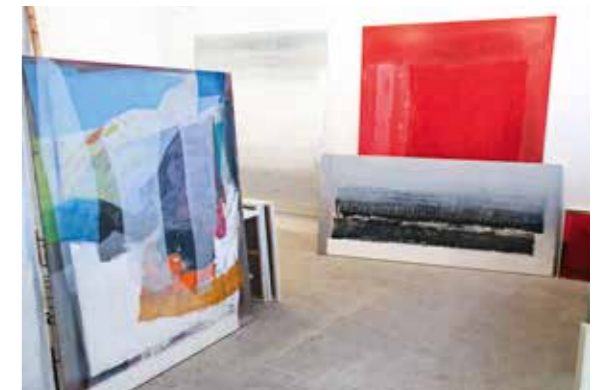
umschlag hinten: visita inaspettata 9, 2018 · 170x170

arnaldo ricciardi – dufourstr. 35, 8008 zürich – info@arnaldo.ch – 078 717 3253