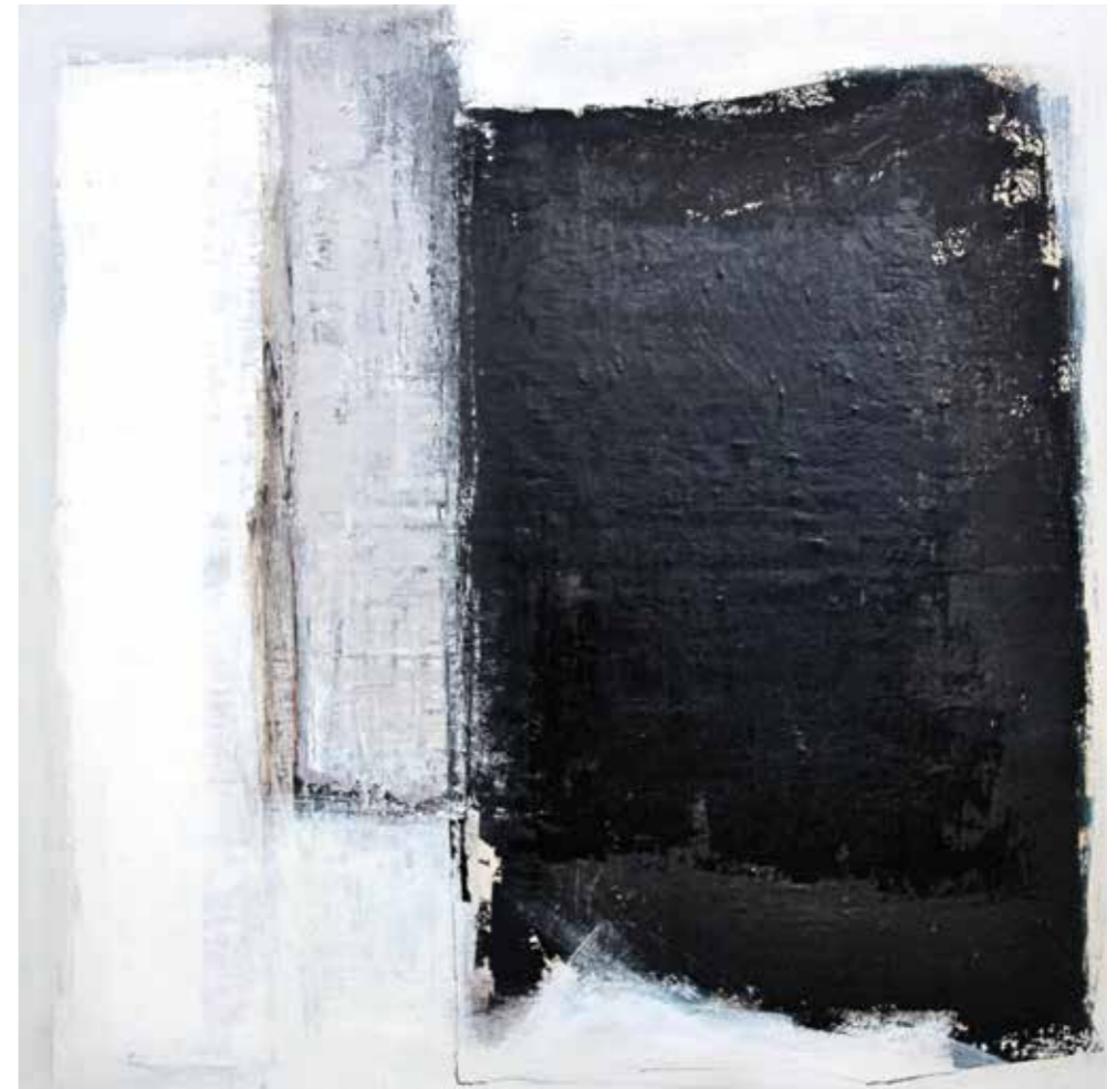
libera scelta 5