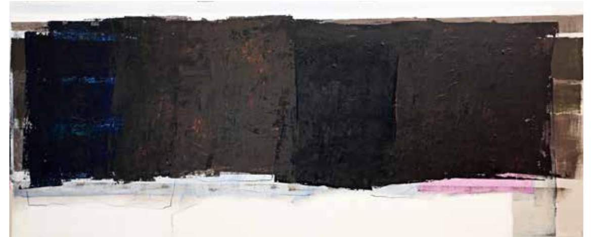
libera scelta 8