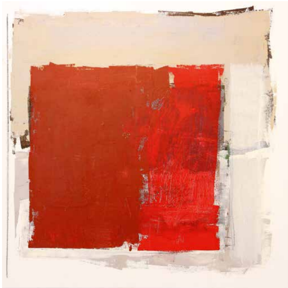
you name it 11